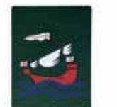
Colegio San Anselmo